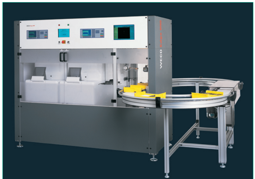
Schleift, bohrt und rillt Brillengläser: der Edge 650 von WECO. Rechts daneben ein großes industrielles Brillenglasrand-Bearbeitungssystem mit maximaler Funktionsausstattung.